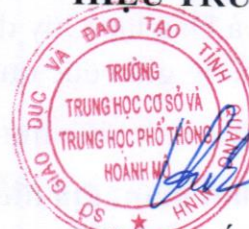
Đặng Quốc Việt